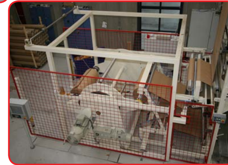
Centervikler: bredde 1600 mm x Ø1600 mm