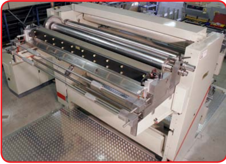
Inline 10001: trykbredde 2200 mm