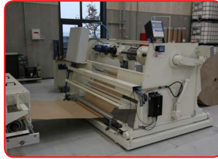
Afruller: bredde 1600 mm x Ø1600 mm