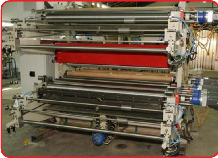
Inline 10003: trykbredde 1600 mm