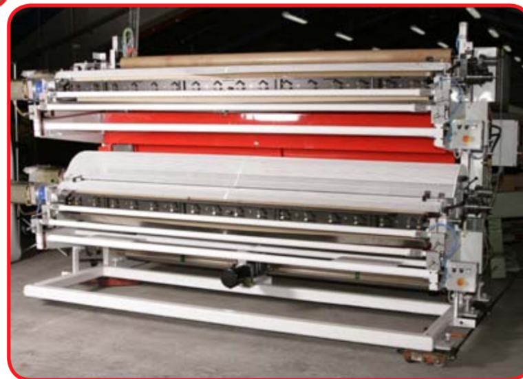
Inline 10004: trykbredde 3200 mm