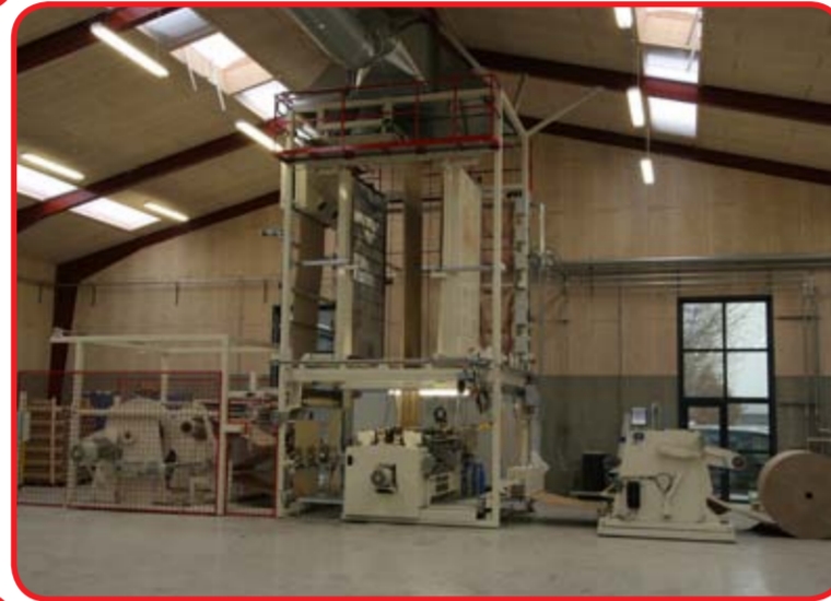
Inline 10002: coatingbredde 1600 mm